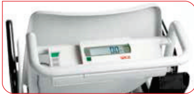
Das Display ist praktisch positioniert und lässt sich leicht bedienen.

Die seca 959 verfügt über vier leichtgängige und wendige Räder, die den Einsatz selbst auf engstem Raum ermöglichen.