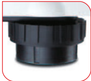
Groe Nivellierfue an der Unterseite der Wiegebasis fur sicheres Aufstellen.