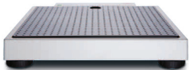
Flache Bauweise und rutschfeste Trittplache fur bequemes Betreten.