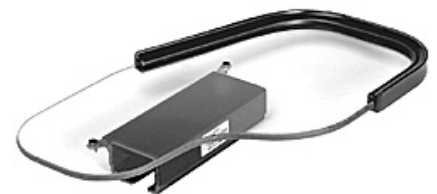
Abbildung: Anatomische Form mit Rand