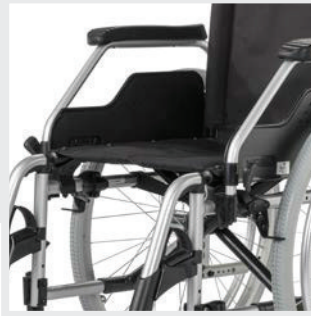
Umrüstung schnell und gezielt möglich