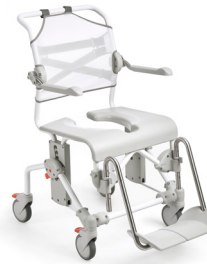
Etac Swift Mobil-2

Einfach und ohne Werkzeug auf unterschiedlich festgelegte Sitzhöhen einstellbar.