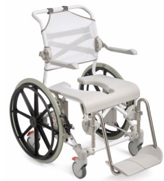
Etac Swift Mobil 24"-2