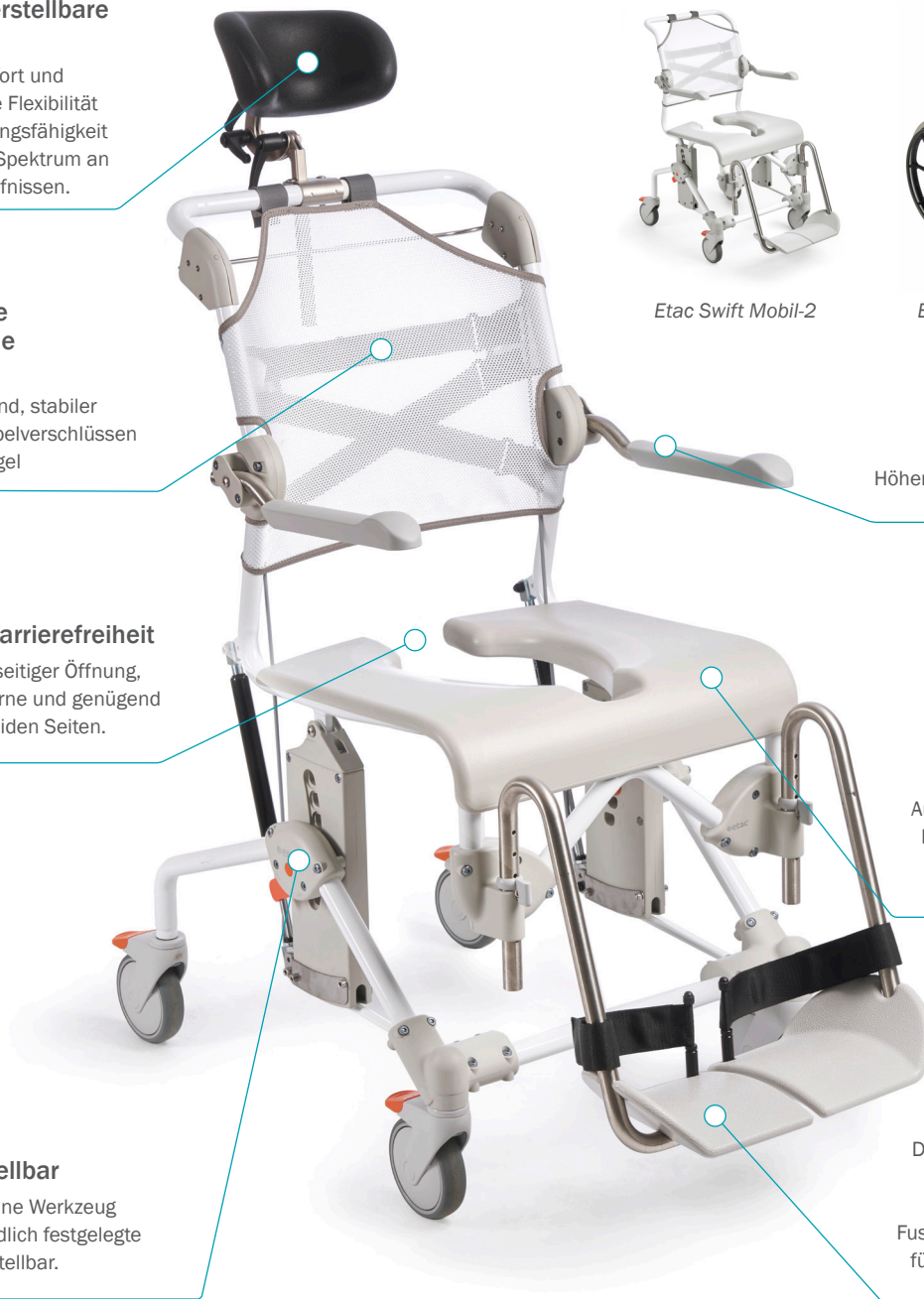
Etac Swift Mobil Tilt-2

Die sanft geschwungenen Fussrasten unterstützen den Fussrücken und das Fussgewölbe und sorgen so für Komfort, Stabilität und Entspannung.