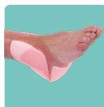
Auch als Sakral- und Fersen- verband erhältlich.