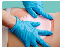
Auch als Sakral-, Fersen- und Multisite-Verband erhältlich.