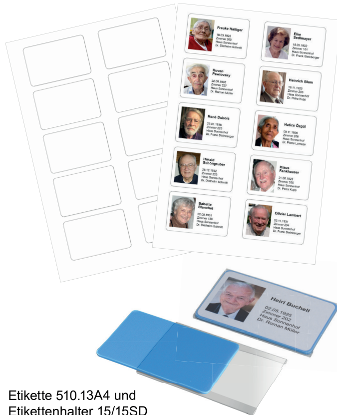
Etikette 510.13A4 und Etikettenhalter 15/15SD

Mit Hilfe des Patientenbildes und der Patientendaten entsteht eine zusätzliche Kontrolle bei der Medikamentenabgabe und erhöht so die Patientensicherheit.