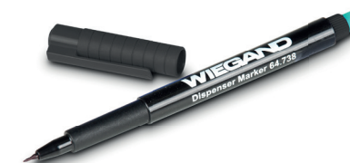
Dispenser Marker Art. Nr.: 64.738