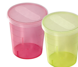
MediBecher, 25 ml Art. Nr.: 71.4, rot Art. Nr.: 71.2, gelb