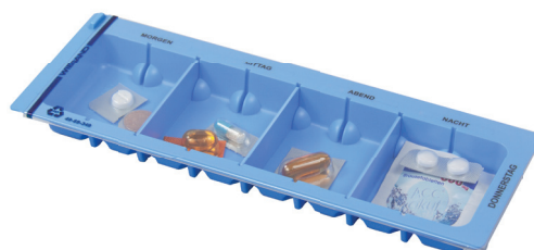
WIEGAND® MediDispenser 341/349