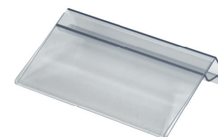
Halter für Blisterbeutel Art. Nr.: 500.240XO.075